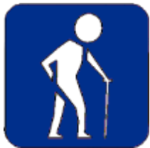
Инвалиды с нарушением опорно-двигательного аппарата

Предметно-развивающая среда - это система материальных объектов деятельности детей, функционально моделирующая содержание духовного и физического развития самих детей. Поэтому педагоги должны уделять огромное внимание изменению, обогащению, улучшению развивающей среды для детей с ОВЗ и детей-инвалидов. Предметная среда должна обеспечивать возможность педагогам эффективно развивать индивидуальность каждого ребенка с учетом его склонностей, интересов, уровнем активности, но самое главное должна способствовать развитию самостоятельности и самодеятельности детей. Педагоги должны моделировать развивающую среду, исходя из возможностей воспитанников, учитывая индивидуальные особенности детей с ОВЗ и детей-инвалидов.