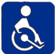
Инвалиды на кресле-коляске